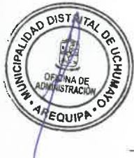
Anexo N° 01

En cuanto a las acciones para promover la implementación de mecanismos de transparencia e integridad en la gestión local, se hace uso de la plataforma INFOBRAS como herramienta principal, a través de la cual se brinda información a la ciudadanía sobre el estado situacional, así como los avances físicos y financieros de las obras, permitiendo un seguimiento transparente, oportuno y accesible de los proyectos de inversión.