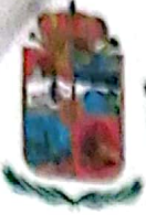
Imagen 01: Folio 160 del Expediente Técnico de la obra "CREACION DEL SERVICIO DE RECREACION EN LA ASOCIACION PROVIENDA VILLA UNION DEL DISTRITO DE UCHUMAYO - PROVINCIA DE AREQUIPA - DEPARTAMENTO DE AREQUIPA"

Adicionalmente, visto que el presupuesto de ejecución de obra no ha sido afectado acorde a lo indicado por el proyectista, no existen falencias presupuestales en el expediente técnico de la obra de referencia, a lo cual el proceso de selección Adjudicación Simplificada Nro. 047-2023-MDU pág. 13 da la facultad a los postores de formular y presentar su propuesta económica dentro del +/-10% del valor referencial, por lo que se brinda la posibilidad a todos los postores de elevar su propuesta económica cuando no se encuentran de acuerdo con los precios y análisis de costos unitarios del expediente técnico, los cuales son documentos referenciales para que las postores puedan establecer su oferta económica siguiendo el orden de prelación establecido en el Art. 35 Sistemas de Contratación del Reglamento de la Ley de Contrataciones con el estado para obras a suma alzada.